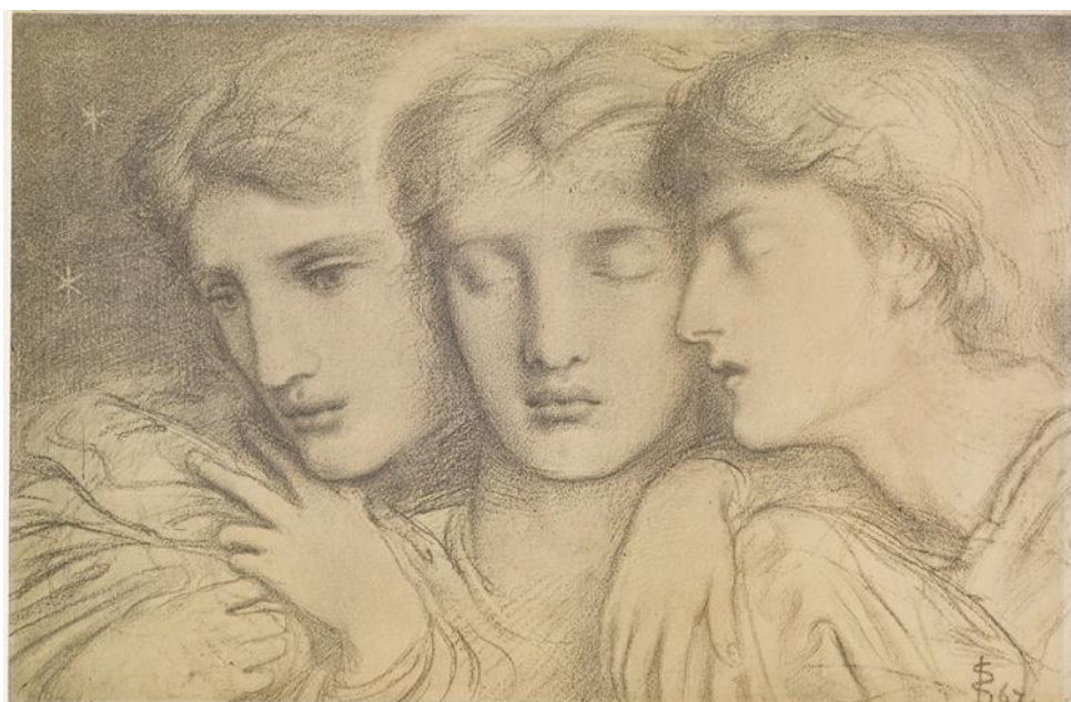
'The Sleepers and One that Watcheth' (1867) by Simeon Solomon (drawing), photo by Birmingham Museums Trust, licensed under CC0